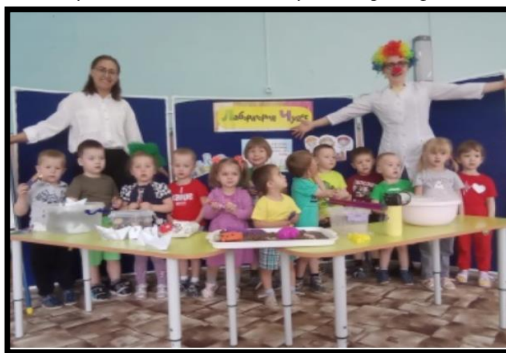
Вторая младшая группа