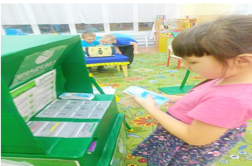
Клиент Варвара «Сбербанка»