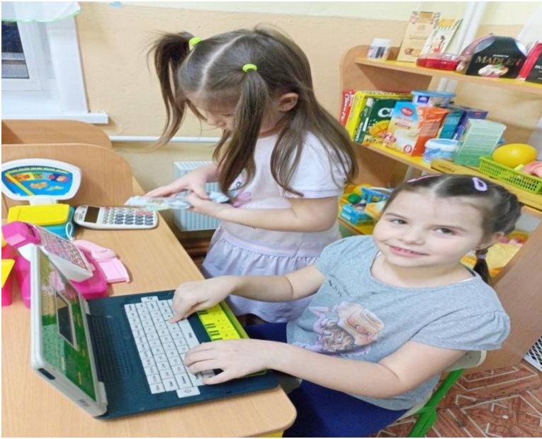
Сюжетно-ролевая игра «Магазин»