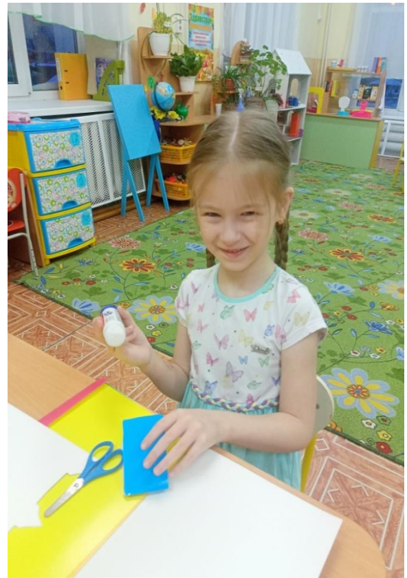
НОД по изготовлению «карт»