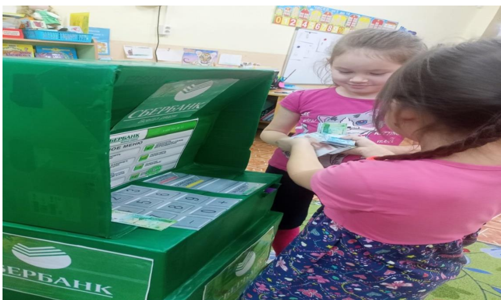
Клиенты «Сбербанка» снимают деньги в банкомате