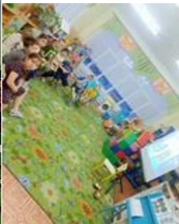
НОД «Экскурсия в сберегательный банк»