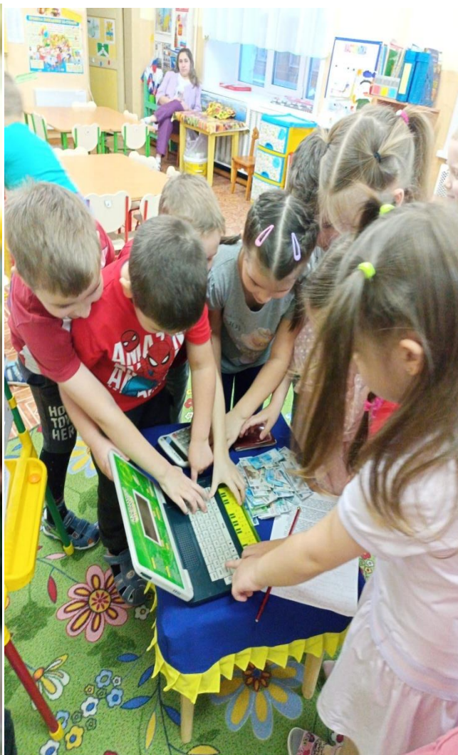
ДИ «Четвертый лишний»