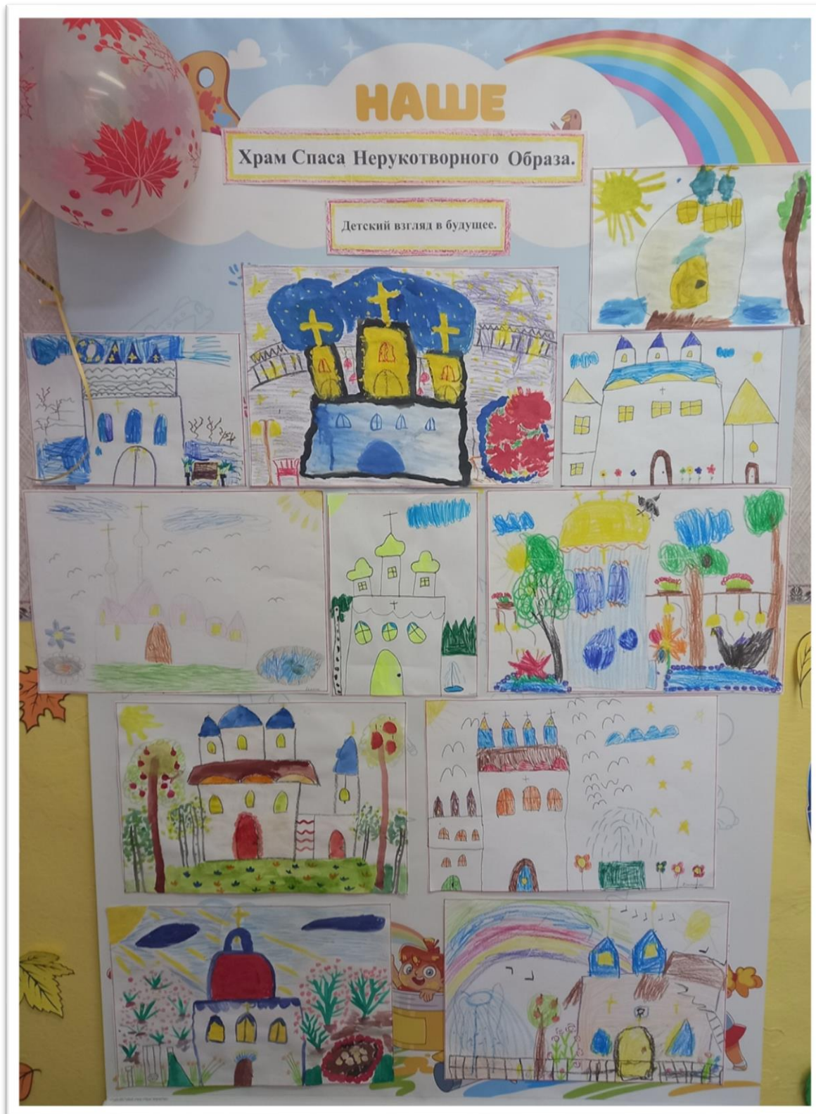
Выставка рисунков: «Храм Спаса Нерукотворного образа. Детский взгляд в будущее»