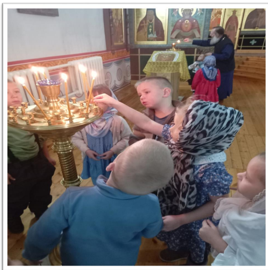
Экскурсия в храм Спаса Нерукотворного Образа