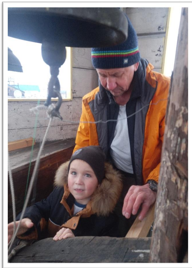
«Путешествие на колокольню. Урок колокольного звона»